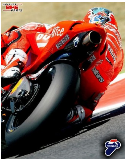
Stoner auf Ducati

Seit 1969 hat sich das Familienunternehmen der Leistungsoptimierung von Motorrädern verschrieben.