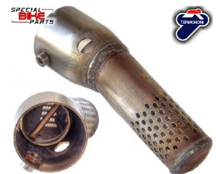
Die herausnehmbaren Phonkiller

Es sind für alle Anlagen Ersatzteile lieferbar.